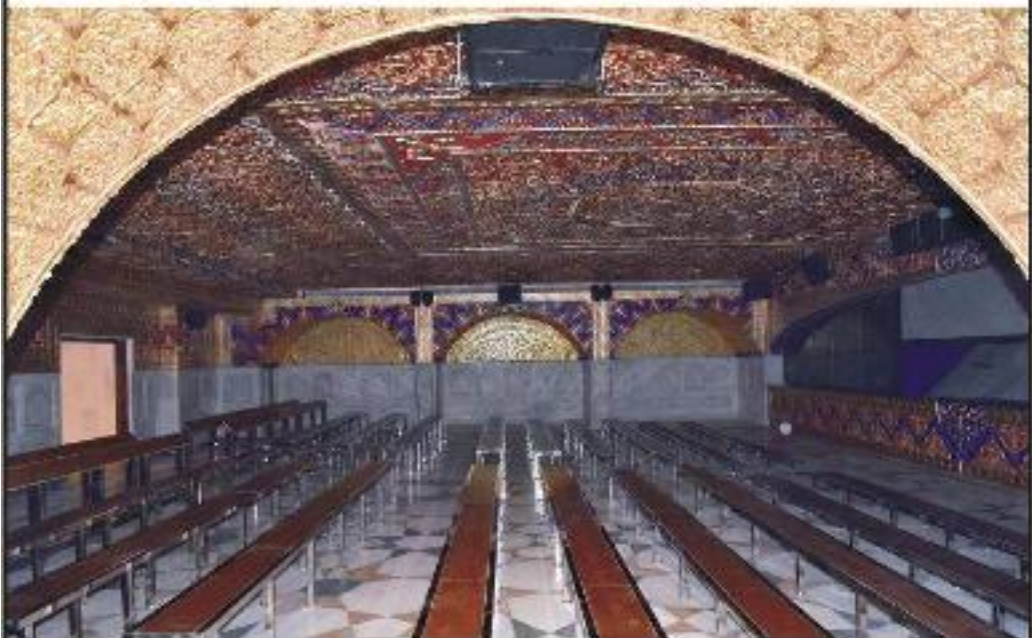
ਸ਼ੀਟਾ ਸਰ ਦੇ ਬਾਹਰ ਬਣੇ ਪਲਾਜ਼ਾ ਦੀ ਬੇਸਮੈਂਟ ਵਿਚ ਬਣਾਏ ਗਏ ਹਾਲ ਦਾ ਪ੍ਰਬੰਧਕਰਨ ਦ੍ਰਿਸ਼।